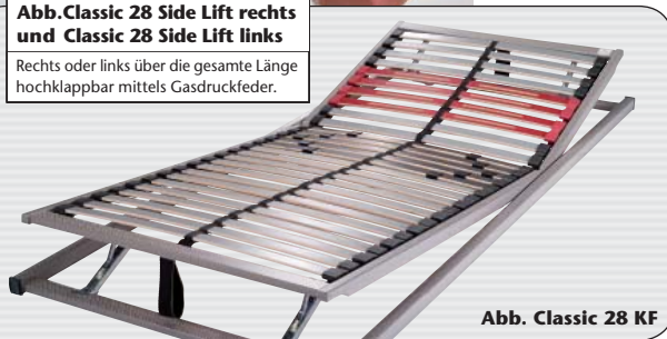
Abb. Classic 28 KF

Rechts oder links über die gesamte Länge hochklappbar mittels Gasdruckfeder.