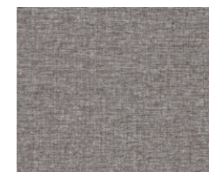
Casual Taupe Silver